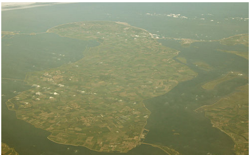
Schouwen-Duiveland vanuit de lucht