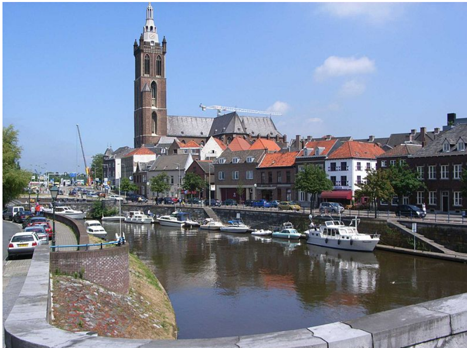
Roermond met de Roer en de St. Christoffelkathedraal