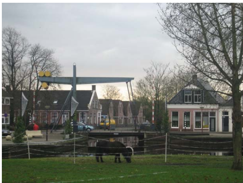
Heerenveen (foto: Erfgoedinspectie, 8-12-09)