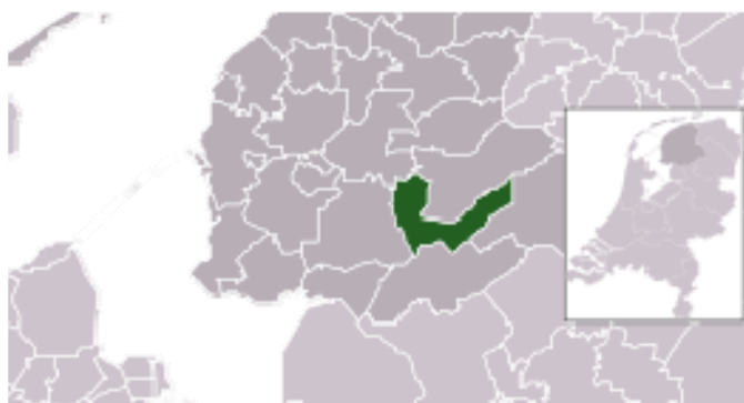
Gemeente Heerenveen

Het inspectierapport kan door de gemeente worden gebruikt om betrokkenen te informeren, beleid bij te stellen en interne verbeteringen uit te zetten. Op deze wijze wil de Erfgoedinspectie de gemeente stimuleren een adequaat monumentenbeleid te voeren.