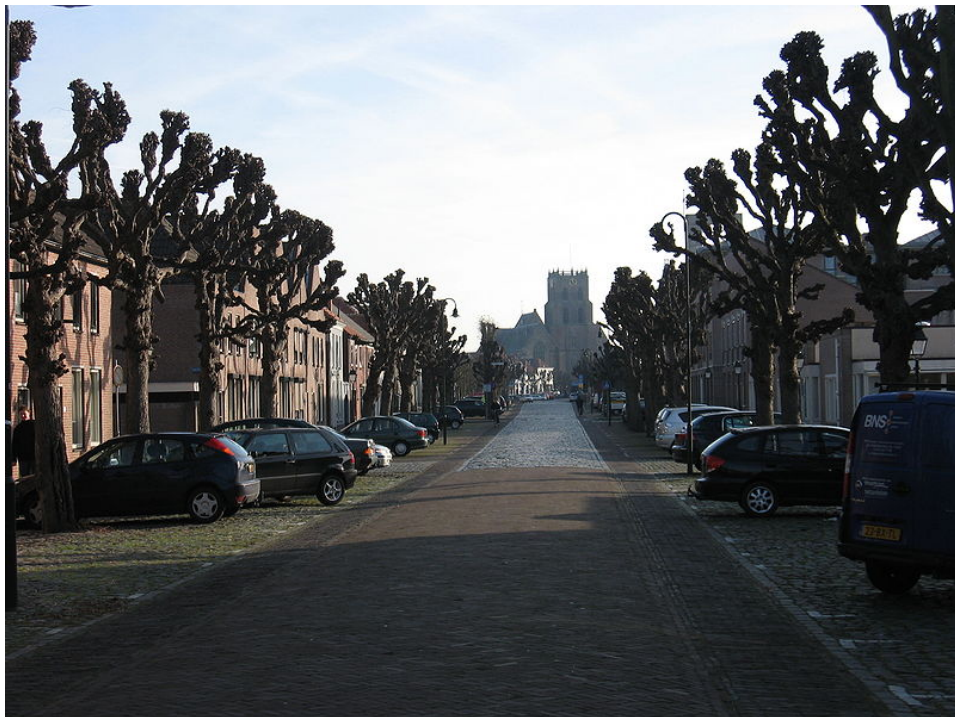
De Markt met de Geertruidskerk