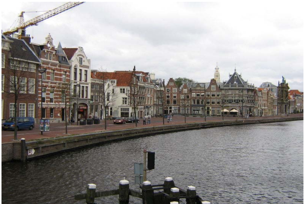
Haarlem aan het Spaarne