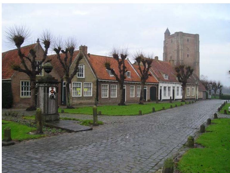
Sint Anna ter Muiden