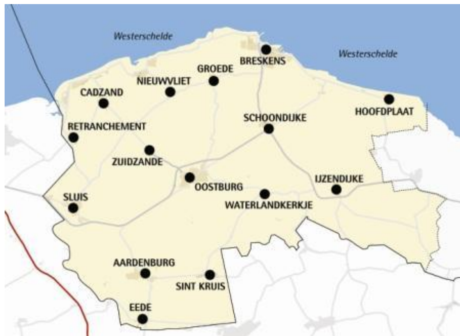
Gemeente Sluis

Sluis is een geografisch grote gemeente in Zeeuws-Vlaanderen, in het uiterste zuidwesten van Nederland. Ze is vernoemd naar het historische vestingstadje Sluis. De gemeente is ontstaan na een fusie van de voormalige gemeente Sluis-Aardenburg met de gemeente Oostburg, in 2003. Sluis bestaat uit 17 afzonderlijke kernen en 56 buurtschappen. Het kleine stadje Sint Anna ter Muiden, dat is ontstaan in 1200 op de linkeroever van het Zwin, is al in 1977 aangewezen als beschermd stadsgezicht. Maar ook kernen als Groede en IJzendijke hebben een onaangetaste historische structuur, zij bezitten echter (nog) geen status als beschermd gezicht.