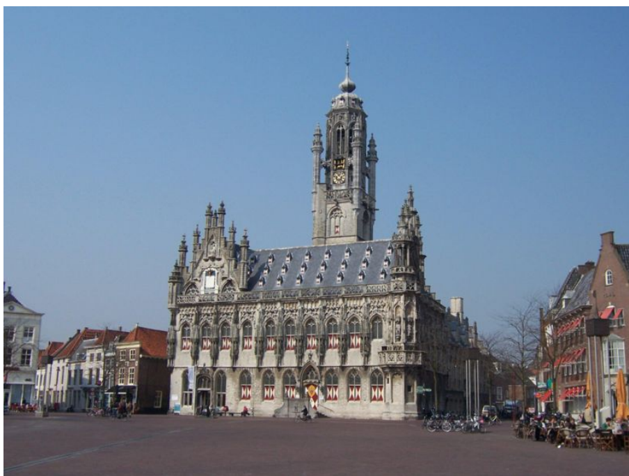
Stadhuis op de Markt