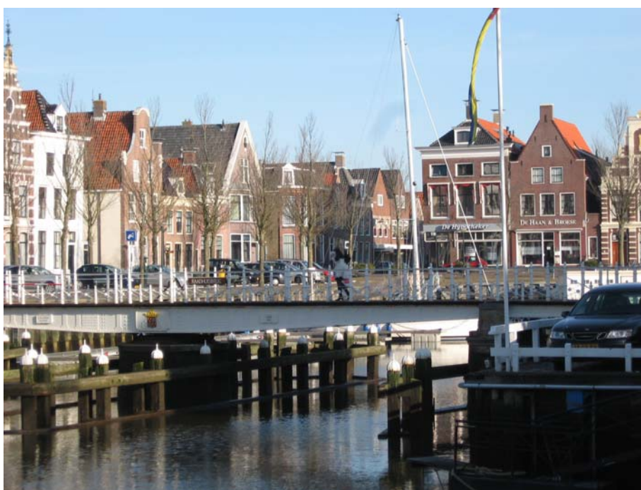
Harlingen - Noordhaven