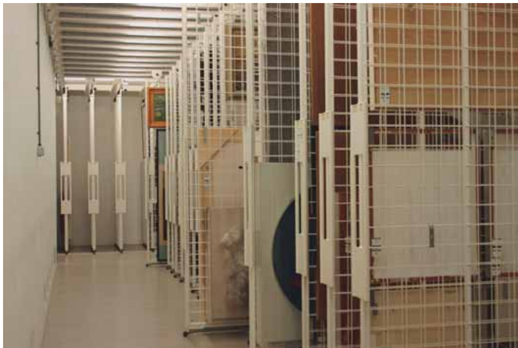
Depot Kröller-Müller Museum, Otterlo