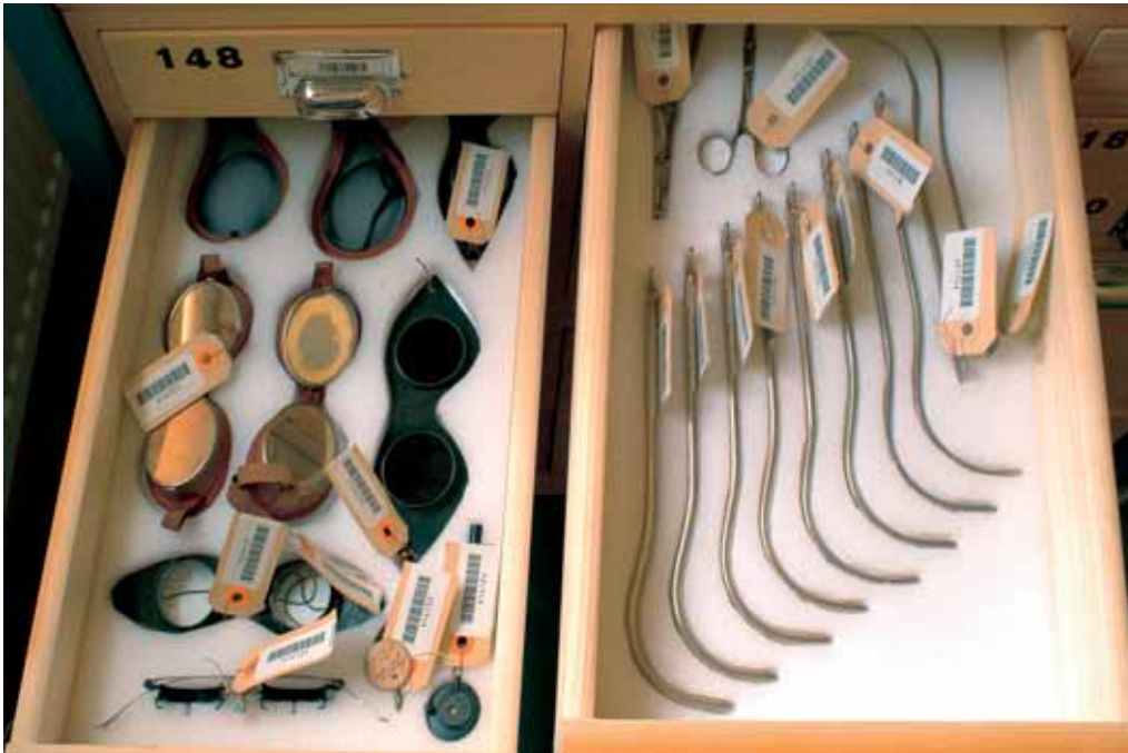
Depot Museum Boerhaave